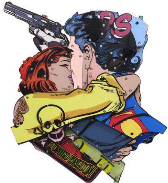
Le baiser de la mort , 2016 Impression sur bois, résine, 58 x 50 cm.

Le Vieux phare de Penmarc'h vous invite à découvrir cet artiste talentueux et ses œuvres originales inspirées du Pop art.