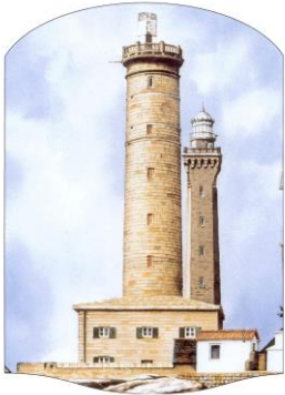
Vieux phare de Penmarc'h