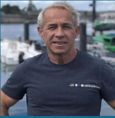
ROLAND JOURDAIN Ambassadeur de la journée