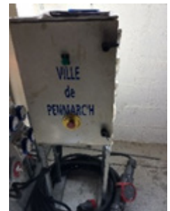
4- Coffrets électriques