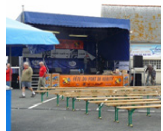
8 - Scène mobile