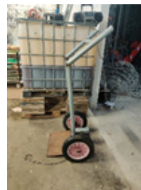
7 - Diable