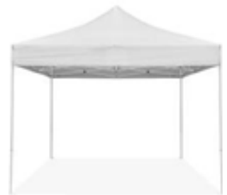
2- Stands parapluie