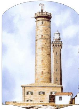
Vieux phare de Penmarc'h