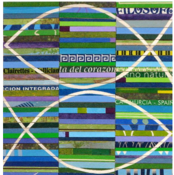
Poissons à la ligne Cageots sur médium, 2016, 17x17 cm.

Différents rendez-vous seront proposés aux visiteurs pour des visites guidées de l'exposition par l'artiste.